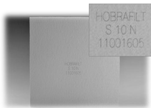
Рис. 2. Выходная часть фильтра-картона